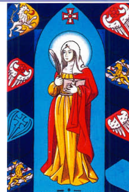
Målning av Davor Zovko

Moto hodočašća: Na Tvoju riječ, Gospodine, bacit ću mrežu!